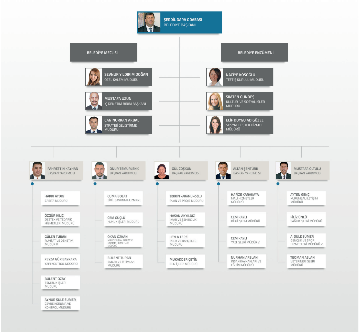
Tablo 1: Teşkilat Yapısı